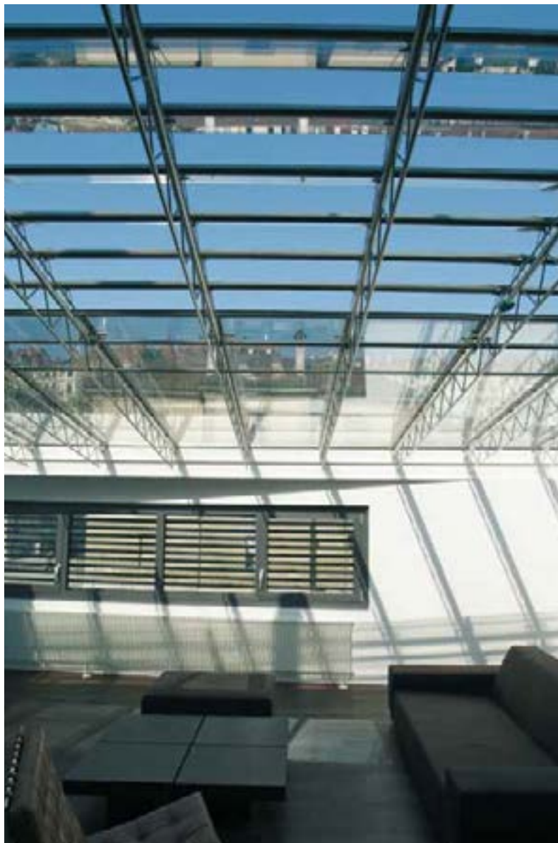
Innenansicht eines Wintergartens: Die Glas-lamellen öffnen und schliessen sich automatisch und stufenlos – selbst bei Regen garantieren sie eine optimale Belüftung.

dass stebler für unkonventionelle Lösungen immer Hand bietet und sich auch bei der Entwicklung neuer und individueller Fassadensysteme durch eine schnelle und flexible Arbeitsweise auszeichnet.» Von der filigranen Bauweise der Fassadenverglasung und dem zusätzlichen Lichteinfall profitiert insbesondere auch der renommierte Fotograf in seinem Atelier.