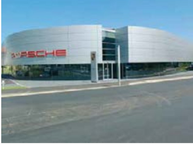
Imposanter Bau mit viel Licht im Showraum des Erdgeschosses – dank stebler-Verglasung.