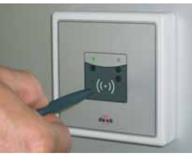
Ein kurzer Kontakt mit dem Badge – und schon ist das Brieffach geöffnet.