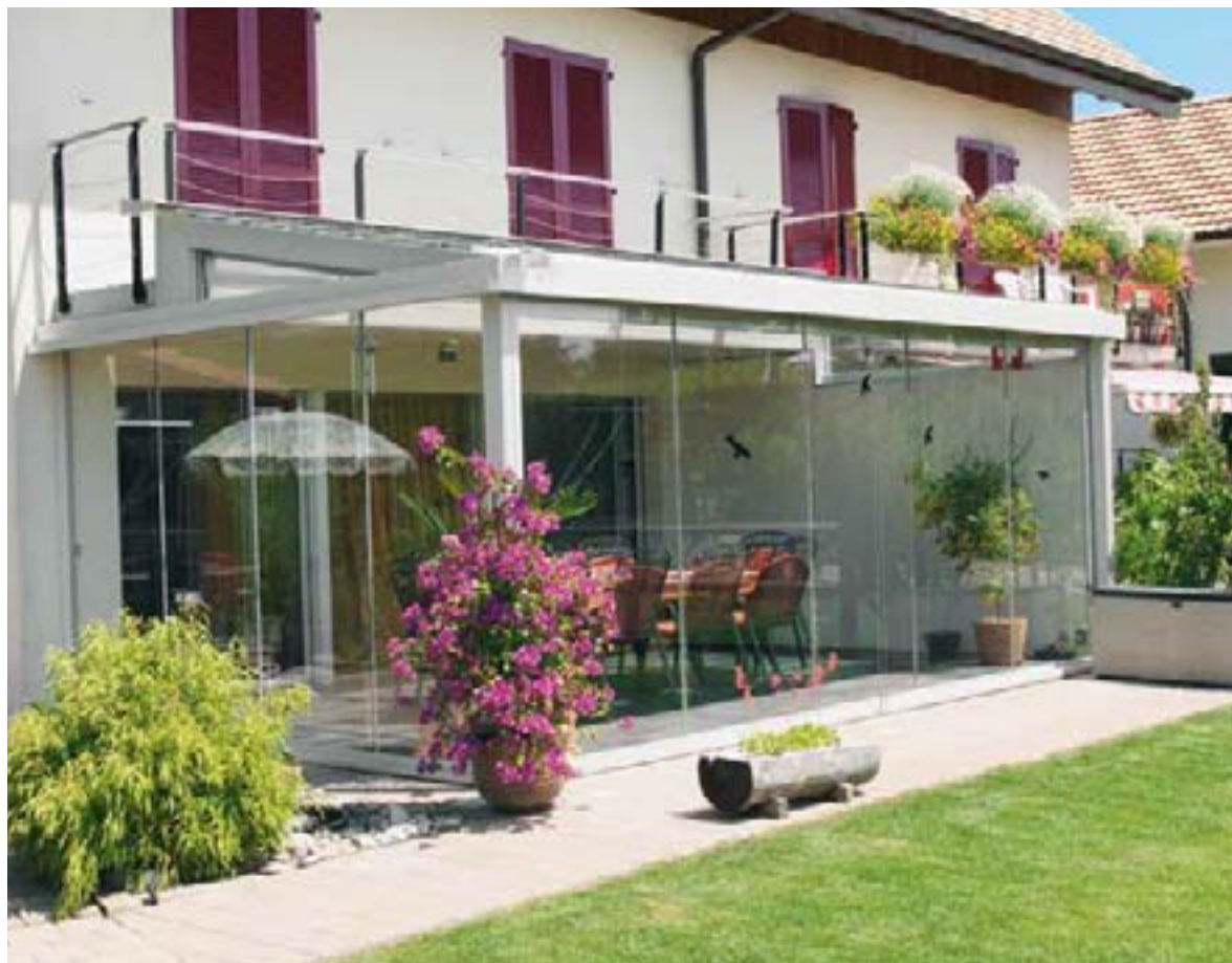
Markanter Pergola-Anbau, der sich architektonisch sehr gut ins Gesamtbild einfügt.